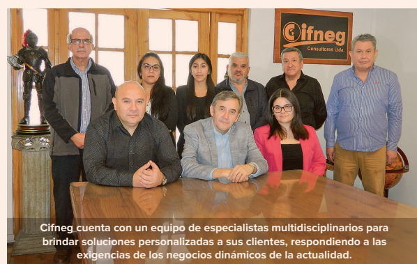
Cifneg cuenta con un equipo de especialistas multidisciplinarios para brindar soluciones personalizadas a sus clientes, respondiendo a las exigencias de los negocios dinámicos de la actualidad.

Apoyar en tomas de decisiones y en cumplimiento tributario, optimizando la justa carga tributaria y contable de sus clientes a fin de darle la tranquilidad necesaria, es la principal motivación del equipo de especialistas multidisciplinarios de Cifneg Consultores, empresa con 25 años de experiencia, cuya oferta se basa en el desarrollo de soluciones personalizadas, que responden a las exigencias de los negocios dinámicos de la actualidad.