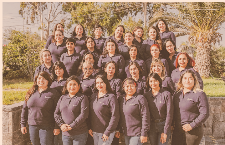
En Orica, es vital crear espacios donde las mujeres puedan expresarse libremente y compartir sus historias; proporcionarles las herramientas y recursos necesarios para que crezcan profesionalmente y alcancen sus metas es primordial. Su compromiso es crear un entorno donde todas las mujeres puedan prosperar y hacer realidad sus aspiraciones profesionales.

Para obtener más información sobre la Escuela de Operadoras y otras iniciativas de diversidad de género en Orica, visite https://www.orica.com/